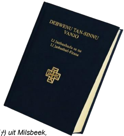
Foto's: Bijbel in de Bomu San taal, van Pater Bloemarts (†) uit Milsbeek, die hieraan heeft meegewerkt.

Al vanaf 1970 zette pater Bloemarts zich in voor de vertaling van de Bijbel en liturgische teksten in het Bomu. Zijn werk begon met de vertaling van catechese-teksten, en mondde in 1983 uit in de eerste editie van het Nieuwe Testament. Hierop volgden de liturgische leesboeken voor de zondagen, en een systematische aanpak voor de vertaling van het Oude Testament. In 2006 werd hij door de bisschop gevraagd een kerkelijk gebedsboek met psalmen te vertalen.